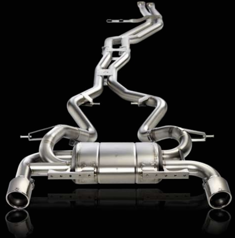
BMW 335i Evolution System

Titanium, 12,4 PS plus, 16,4 Nm plus, 19,85 kg minus